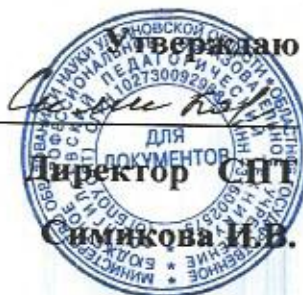
График проведения мероприятий, направленных на содействие в трудоустройстве выпускников ОГБПОУ «Сенгилеевский педагогический техникум» в 2016-2017 учебном году