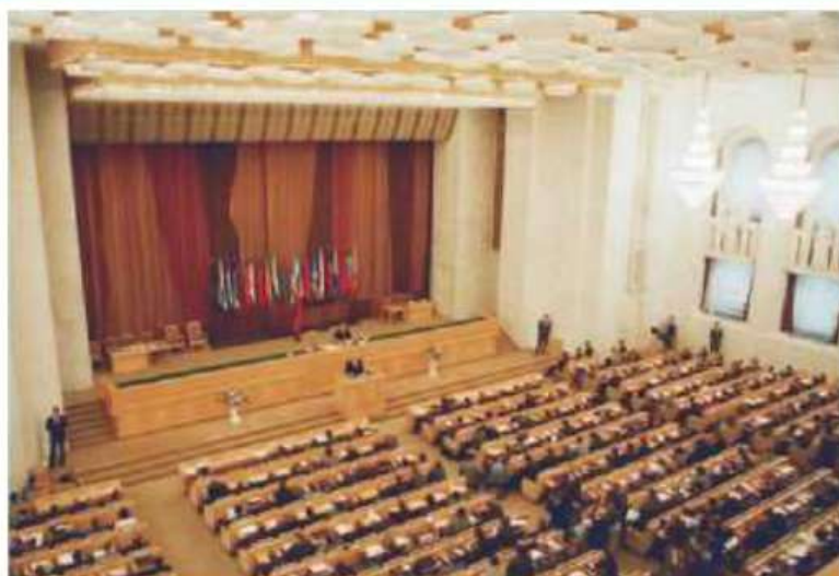
Первое пленарное заседание Конституционного совещания. Москва, Кремль, 5 июня 1993 г.

Конституционное совещание было создано в Москве летом 1993 г.